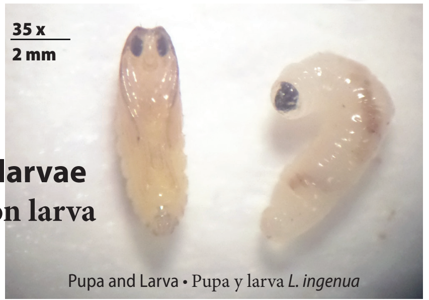
Pupa and Larva • Pupa y larva L. ingenua

Sciariid fly with larvae Mosca Ciárida con larva