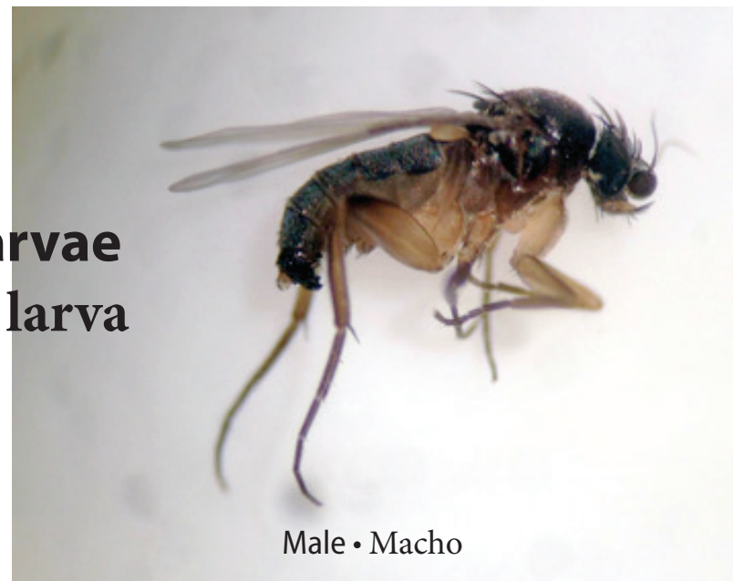
Male • Macho

Phorid fly with larvae Mosca Fórida con larva