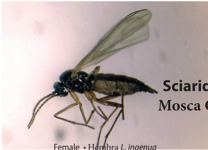
Female • Hembra L. ingenua

Sciariid fly with larvae Mosca Ciárida con larva