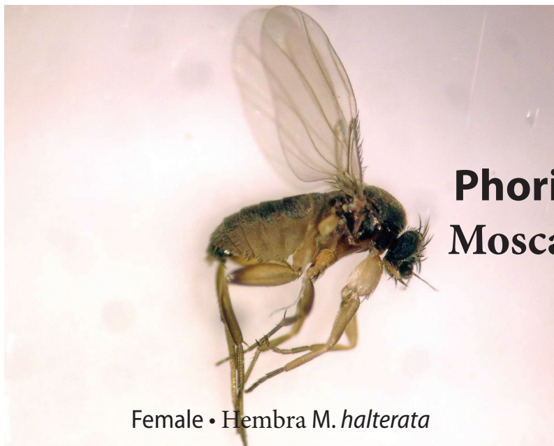
Female • Hembra M. halterata

Phorid fly with larvae Mosca Fórida con larva